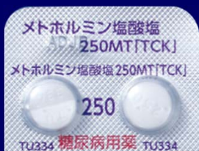
メトホルミン塩酸塩錠250mgMT「TCK」