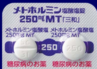
メトホルミン塩酸塩錠250mgMT「三和」