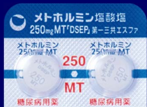
メトホルミン塩酸塩錠250mgMT「DSEP」