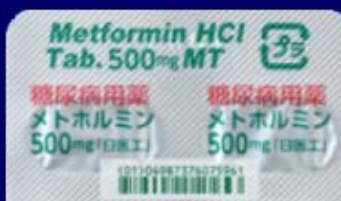
糖尿病用薬 糖尿病用薬