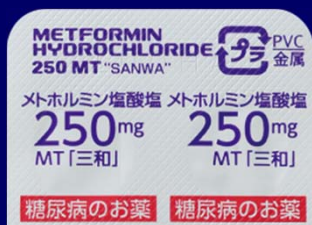
糖尿病のお薬 糖尿病のお薬