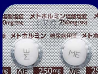
メトホルミン塩酸塩錠250mg「SN」