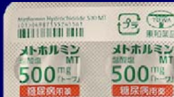
糖尿病用薬 糖尿病用薬