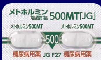
メトホルミン塩酸塩錠500mgMT「JG」