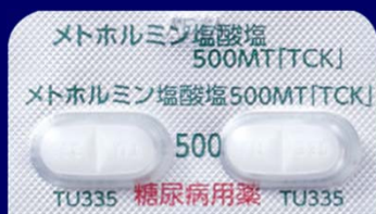
メトホルミン塩酸塩錠500mgMT「TCK」