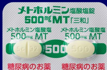
糖尿病のお薬 糖尿病のお薬