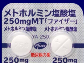
メトホルミン塩酸塩錠250mgMT「ファイザー」