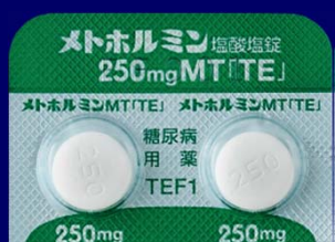
メトホルミン塩酸塩錠250mgMT「TE」