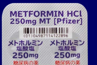
糖尿病の薬 糖尿病の薬