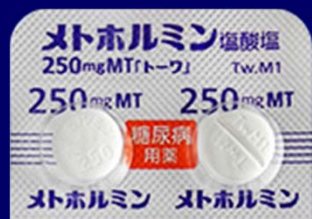
メトホルミン塩酸塩錠250mgMT「トワ」