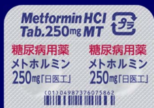
糖尿病用薬 糖尿病用薬