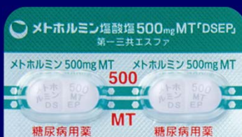
メトホルミン塩酸塩錠500mgMT「DSEP」