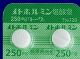
メトホルミン塩酸塩錠250mg「トールワ」