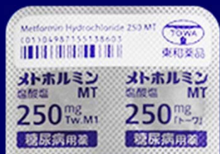
糖尿病用薬 糖尿病用薬