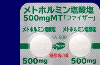
糖尿病の薬 糖尿病の薬