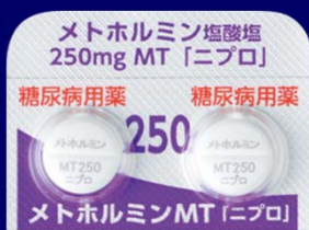
メトホルミン塩酸塩錠250mgMT「ニプロ」