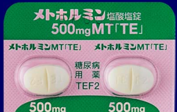
メトホルミン塩酸塩錠500mgMT「TE」