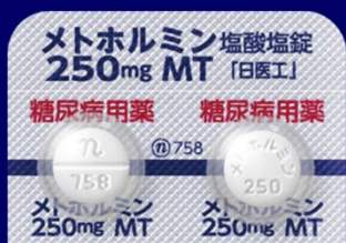
メトホルミン塩酸塩錠250mgMT「日医工」