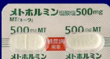
糖尿病用薬 糖尿病用薬