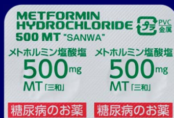
糖尿病のお薬 糖尿病のお薬