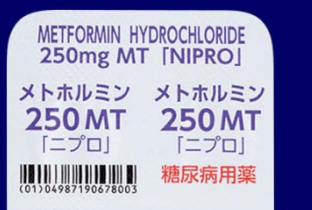
糖尿病用薬 糖尿病用薬