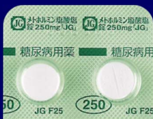
メトホルミン塩酸塩錠250mg「JG」