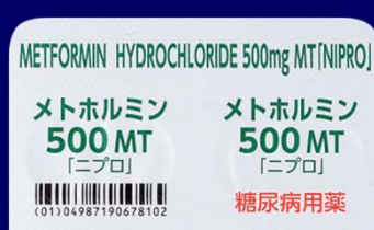
糖尿病用薬 糖尿病用薬