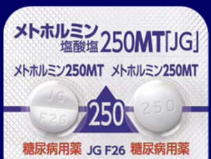
メトホルミン塩酸塩錠250mgMT「JG」