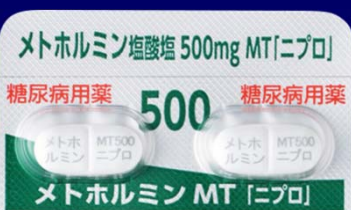
糖尿病用薬 糖尿病用薬