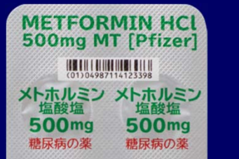
糖尿病の薬 糖尿病の薬