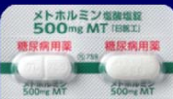
糖尿病用薬 糖尿病用薬