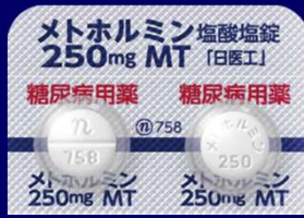
メトホルミン塩酸塩錠250mgMT「日医工」