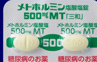
メトホルミン塩酸塩錠500mgMT「三和」