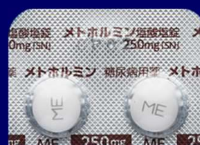
メトホルミン塩酸塩錠250mg「SN」