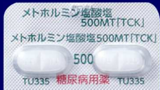
メトホルミン塩酸塩錠500mgMT「TCK」