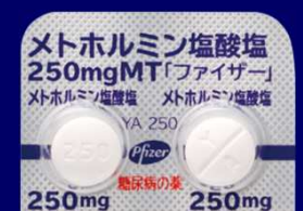
メトホルミン塩酸塩錠250mgMT「ファイザー」