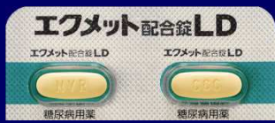
エクメット配合錠 LD