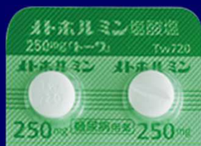
メトホルミン塩酸塩錠250mg「トーフ」