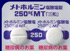
メトホルミン塩酸塩錠250mgMT「三和」