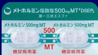
メトホルミン塩酸塩錠500mgMT「DSEP」