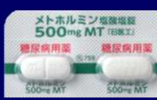
メトホルミン塩酸塩錠500mgMT「日医工」