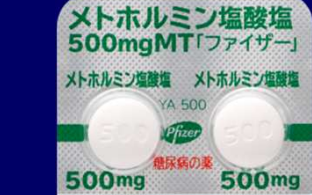
メトホルミン塩酸塩錠500mgMT「ファイザー」