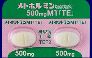
メトホルミン塩酸塩錠500mgMT「TE」