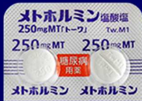
メトホルミン塩酸塩錠250mgMT「トーフ」