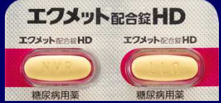
エクメット配合錠 HD