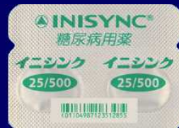
イニシンク配合錠