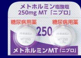
メトホルミン塩酸塩錠250mgMT「ニプロ」