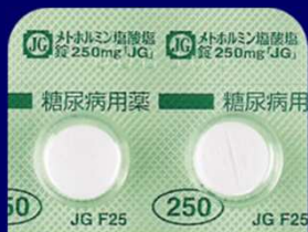
メトホルミン塩酸塩錠250mg「JG」