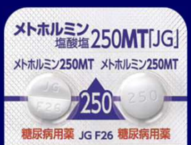
メトホルミン塩酸塩錠250mgMT「JG」