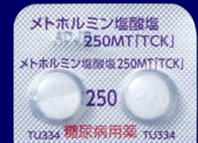
メトホルミン塩酸塩錠250mgMT「TCK」