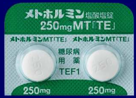
メトホルミン塩酸塩錠250mgMT「TE」