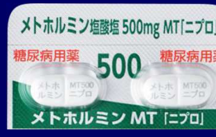
メトホルミン塩酸塩錠500mgMT「ニプロ」