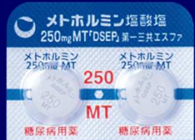
メトホルミン塩酸塩錠250mgMT「DSEP」