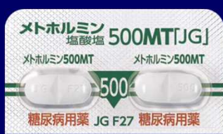
メトホルミン塩酸塩錠500mgMT「JG」