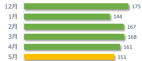
相談件数の推移（直近 6 か月）

遺族等の求めに応じて相談内容をセンターが医療機関へ伝達したものは 1 件でした。（累計 20 件）